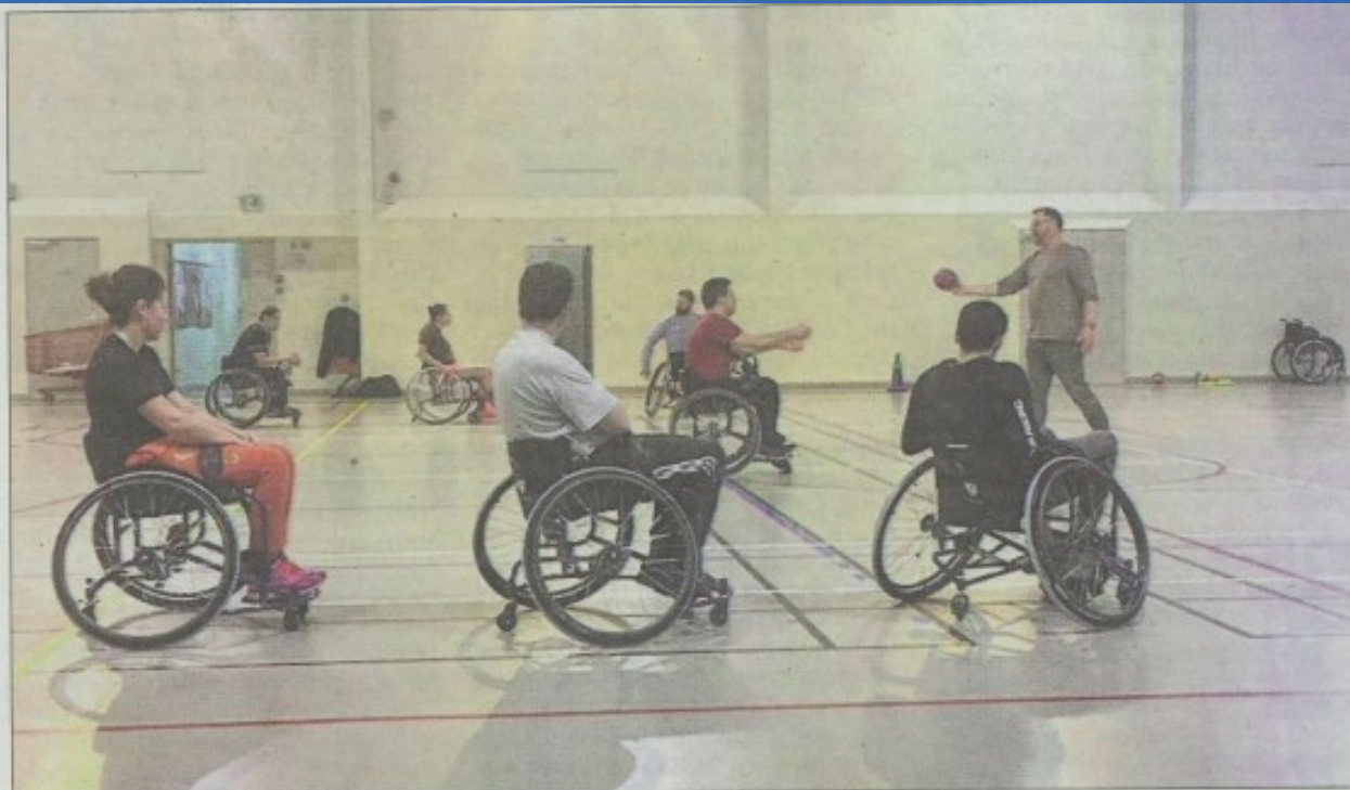
Pour le moment, le club se limite à une pratique loisir.

Vingt mille euros étaient nécessaires pour l'achat de huit fauteuils. Tout le monde a mis la main à la poche. Une demande de financement participatif a permis de lever 2 500 euros, le prix d'un fauteuil.