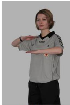
Marcher ou 3 secondes