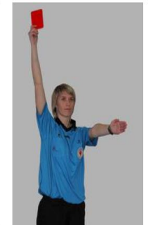
Avertissement / Disqualification