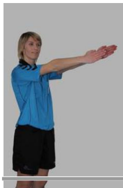
Remise en jeu