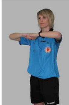
Ceinturer, retenir ou pousser