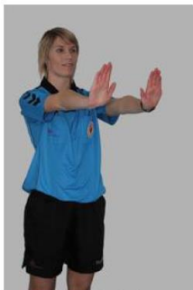
Non respect des 3 mètres