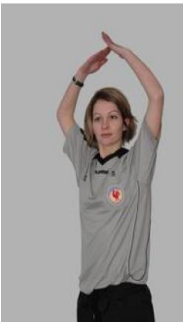
Arrêt du temps de jeu