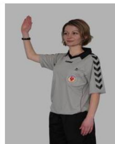
Gestion d'avertissement du jeu passif

Cela vous paraît simple ? ..... Engagez-vous !