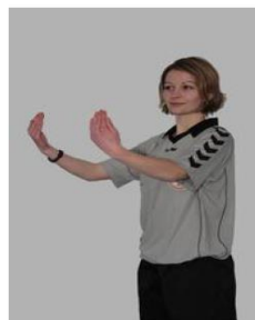
Autor. à 2 pers. de pénétrer sur le terrain